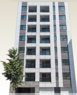
外観(令和元年7月撮影)